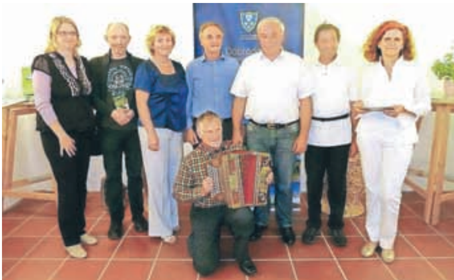
Predstavniki štirih občin na odprtju skupne razstave o lokalni turistični ponudbi, ki je bila v začetku junija na ogled v Petrovčevi hiši.

Na razstavi so turistične zanimivosti svojih občin in pester promocijski material predstavili predstavniki občin Preddvor, Šenčur in Naklo, za glasbeno obogatitev dogajanja pa je poskrbel