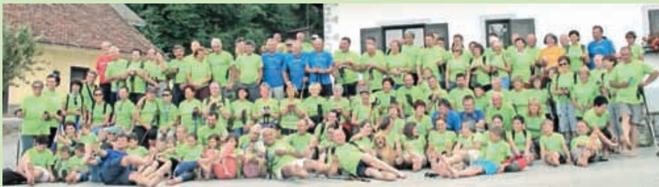
Skupinska fotografija letošnjih bosonogih udeležencev pohoda na Šenturško goro