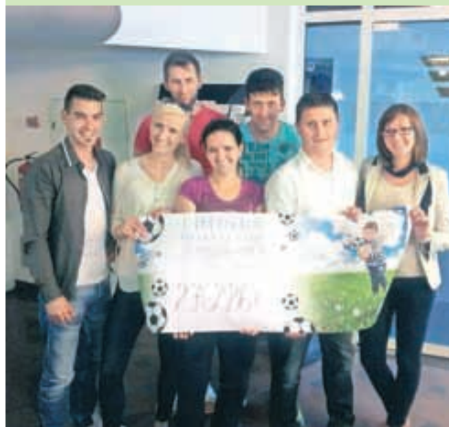
Zbrani denar je po zaslugi organizatorjev zares prišel v prave roke.