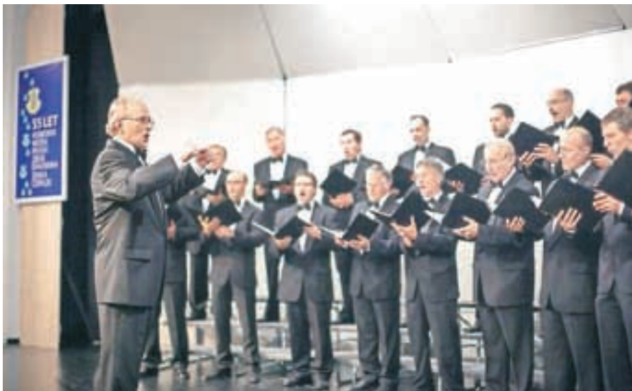
Komorni moški pevski zbor Davorina Jenka