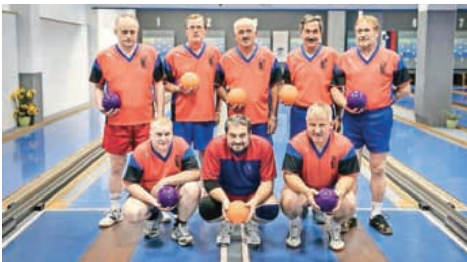
Kegljači Športnega društva Adergas na treningu v Kranju