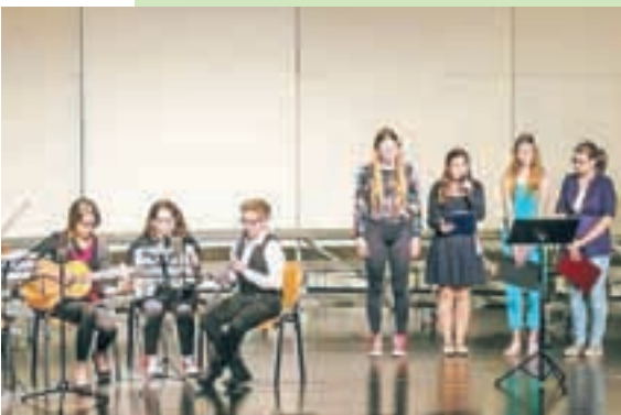
Svojo točko so imeli tudi člani projekte skupine za jezike.