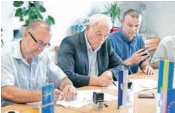
Župan Franc Čebulj ob podpisu gradbene pogodbe

Občina Cerklje bo za nadgradnjo CCN Domžale-Kamnik morala zagotoviti 1,5 milijona evrov.