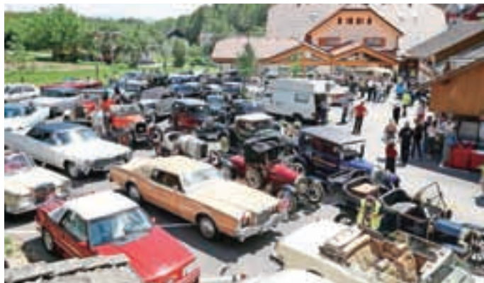
Parkirišče Domačije Vodnik so starodobniki zapolnili do zadnjega kotička.

Člani Društva starodobnih vozil Kamnik so letošnjo že tradicionalno mednarodno revijo starodobnikov razširili vse do Kranja in tako so se stari lepotci konec maja pokazali tudi v Adergasu in Cerkljah.