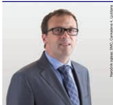
Naročnik oglaš: SMC, Cankarjeva 4, Ljubljana