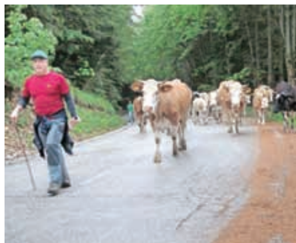
Kmetje so svojo živino na Krvavec prignali v prvi polovici junija.